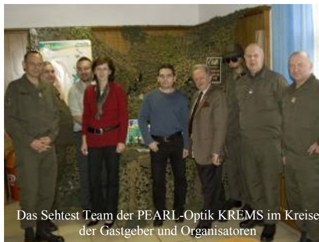
Das Sehtest Team der PEARL-Optik KREMS im Kreise der Gastgeber und Organisatoren

Das Angebot welches von über 100 Bediensteten wahrgenommen wurde fand bereits zum vierten Mal statt. Diese Untersuchung ersetzt zwar keine Gesundenuntersuchung beim Hausarzt, ist aber eine Momentaufnahme, bei der eventuelle Gefahrenquellen erkannt und somit frühzeitig medizinisch behandelt werden können. Einige Bedienstete vereinbarten direkt vor Ort einen Termin bei ihrem Augenarzt, als sie bemerkten wie gut sie