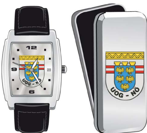
Uhr der UOG/NÖ