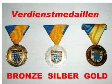
Verdienstmedaille der UOG/NÖ in BRONZE, SILBER, GOLD