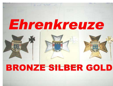
Ehrenkreuz der UOG/NÖ in BRONZE, SILBER, GOLD