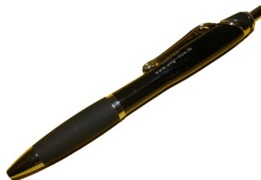
Kugelschreiber der UOG/NÖ