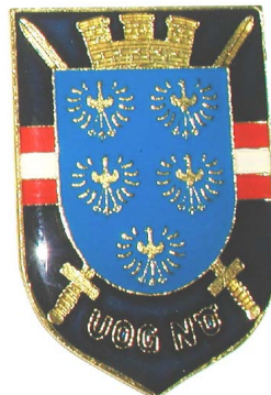
Ehrenschild der UOG/NÖ