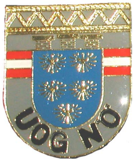
Ehrenzeichen der UOG/NÖ

anzufordern/ bestellen über Deinen Obmann/ Zweigstellenleiter