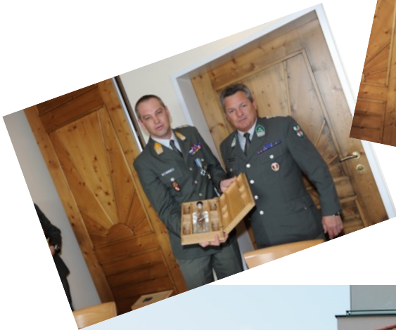
Unteroffizier seinen Stellenwert hat.

Zusammengefasst war es eine vom Präsidenten der UOG/NÖ und seinem Team gut organisierte Generalversammlung. Tagungsort und Ablauf waren gut gewählt, man merkte, dass in der Weinstadt Poysdorf willkommen war und der man