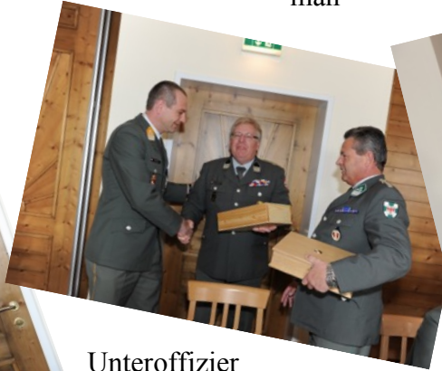
Österreichische gerade im Weinviertel noch